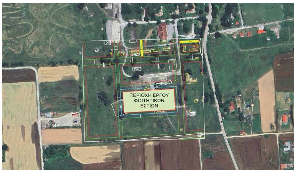
Εικόνα 8: Προτεινόμενη χωροθέτηση Φοιτητικών Εστίων στο γήπεδο του Π.Δ.Μ. στην πόλη της Πτολεμαΐδας

Το προτεινόμενο συγκρότημα φοιτητικών εστίων προτείνεται να έχει συνολική δυναμικότητα φιλοξενίας περίπου 100 ατόμων.