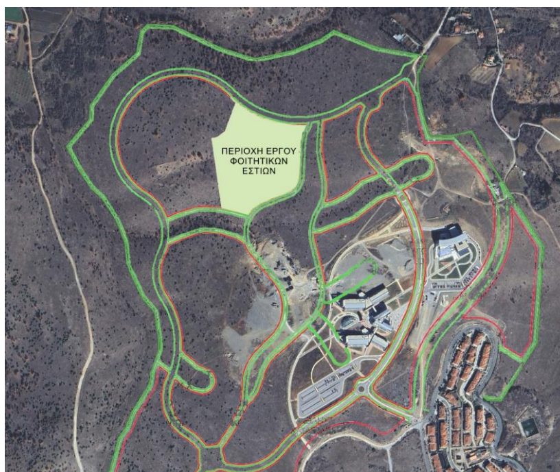
Εικόνα 2: Προτεινόμενη χωροθέτηση Φοιτητικών Εστιών στο Ο.Τ.5