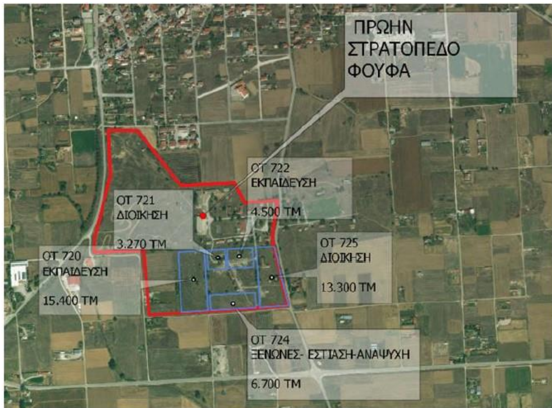
Εικόνα 7: Οριοθέτηση οικοπέδου πρώην στρατοπέδου «ΦΟΥΦΑ» και του Ο.Τ. 724, εντός του οποίου προτείνεται η ανέγερση των Φοιτητικών Εστίων Πτολεμαΐδας

Η χωροθέτηση του συγκροτήματος της φοιτητικής μέριμνας προτείνεται να υλοποιηθεί εντός του Ο.Τ. 724, συνολικού εμβαδού 6.639,87 τ.μ.