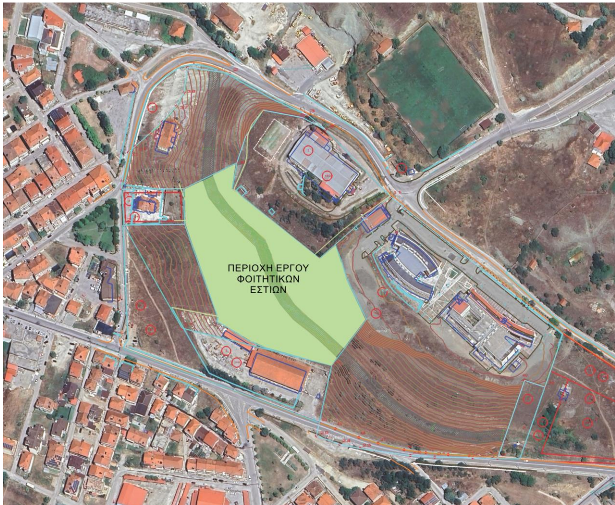
Εικόνα 4: Προτεινόμενη χωροθέτηση Φοιτητικών Εστίων στο γήπεδο του Π.Δ.Μ. στην πόλη της Καστοριάς