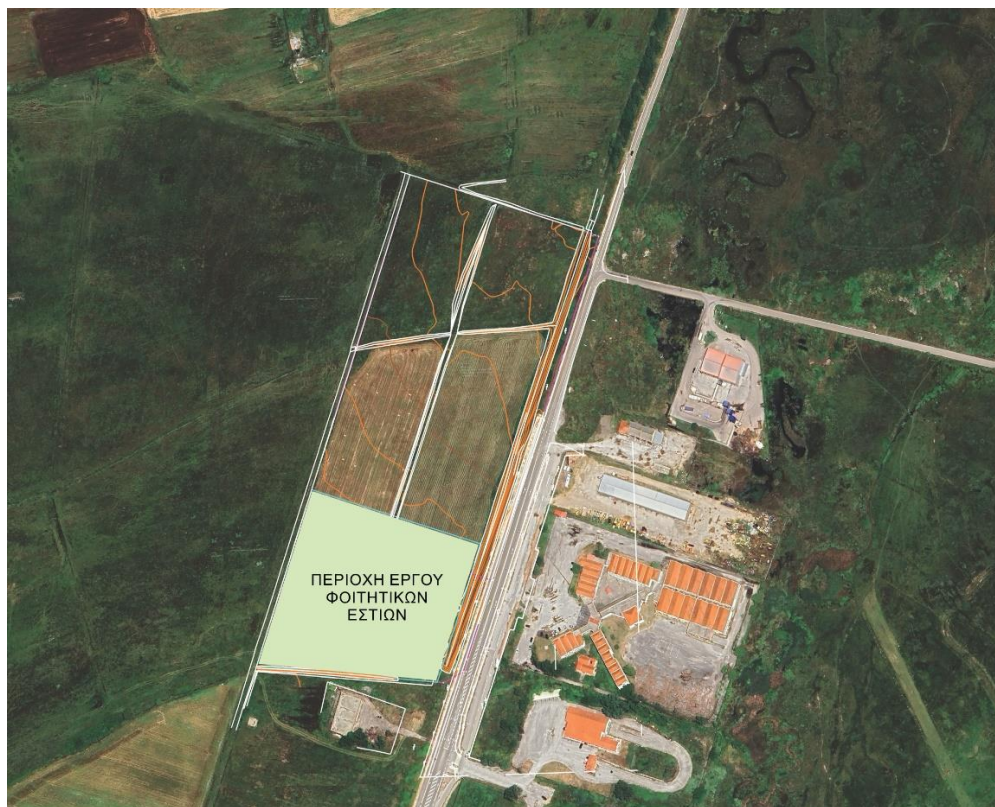
Εικόνα 6: Προτεινόμενη χωροθέτηση Φοιτητικών Εστίων στο γήπεδο του Π.Δ.Μ. στην πόλη της Φλώρινας

Το συγκρότημα φοιτητικών εστίων προτείνεται να έχει συνολική δυναμικότητα φιλοξενίας περίπου 150 ατόμων και φοιτητική λέσχη δυναμικότητας 350 ατόμων.