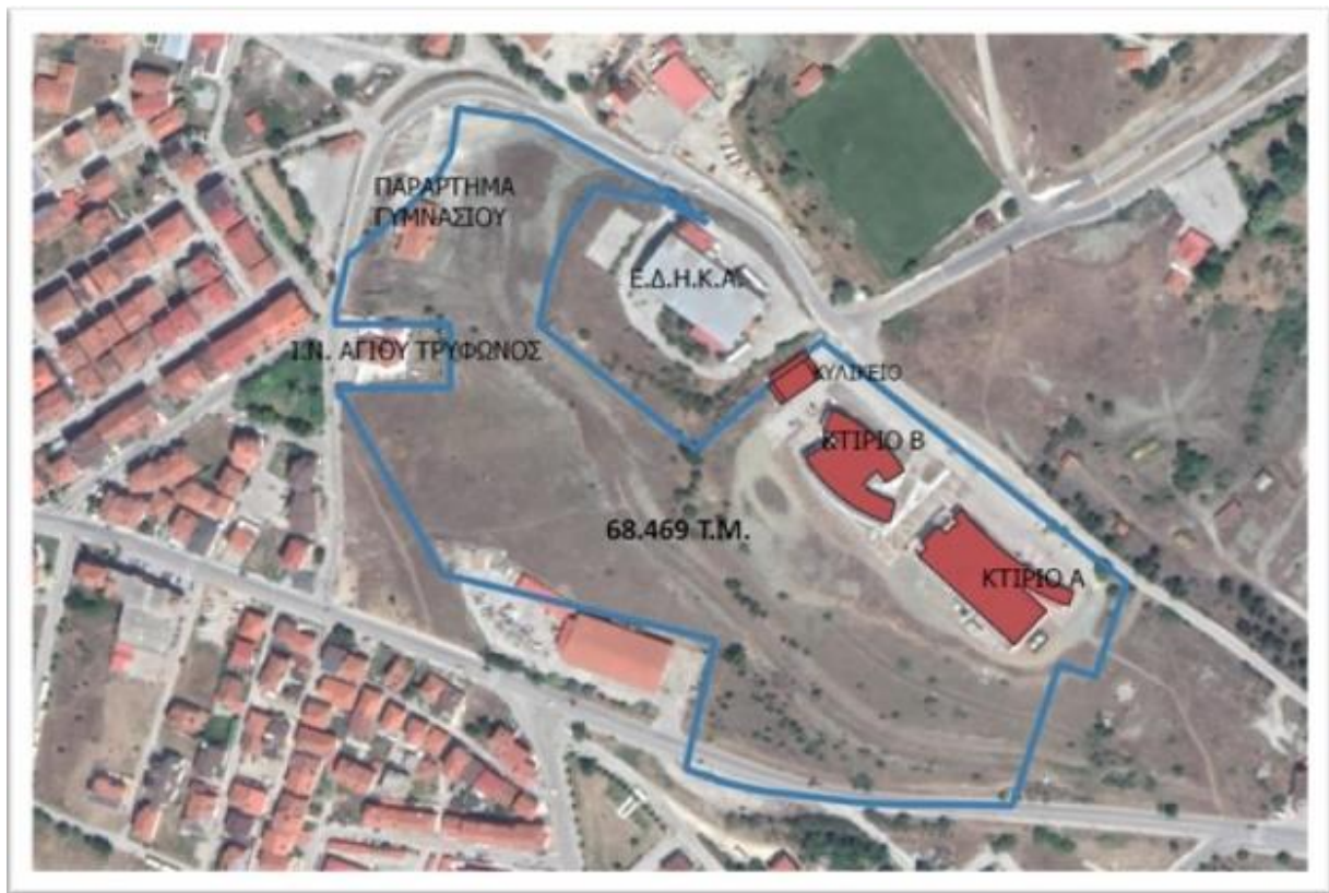
Εικόνα 3: Άποψη του γηπέδου του Π.Δ.Μ. στην πόλη της Καστοριάς, εντός του οποίου έχει προγραμματιστεί να ανεγερθούν οι φοιτητικές εστίες Καστοριάς